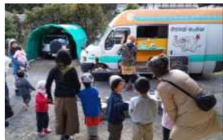
▲2020年度プロジェクトの一例