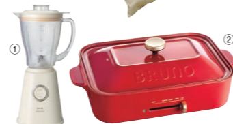
〈ブルーノ〉キッチン家電2点セット 【5点限り】