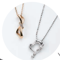
〈フェスタリア ビジュソフィア〉 ダイヤモンドネックレス各種 【20点限り】