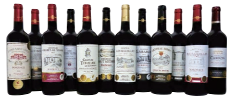
ダブル金賞受賞フランス・ボルドー赤ワイン 12本セット 【50点限り】 赤、750ml×12