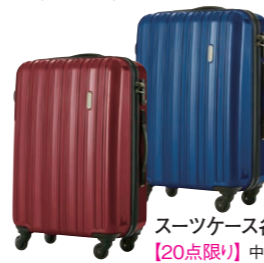
スーツケース各種 【20点限り】 中国製