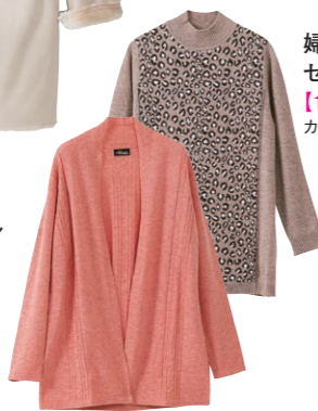
婦人カシミア セーター各種 【100点限り】 カシミア100%