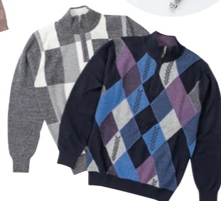
紳士カシミアセーター各種 【100点限り】 カシミア100%、日本製