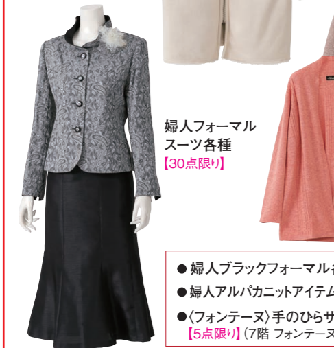
婦人フォーマル スーツ各種 【30点限り】