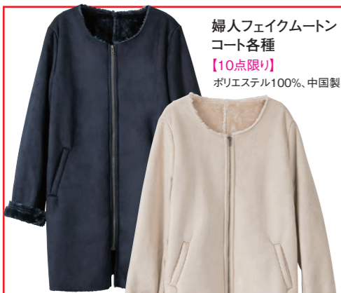
婦人フェイクムートン コート各種 【10点限り】 ポリエステル100%、中国製