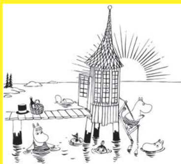
「ちびのミイがやってきた!」下絵原画