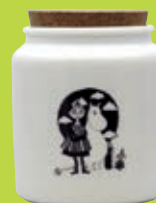
展覧会限定 瓶入りコーヒー 1,620円