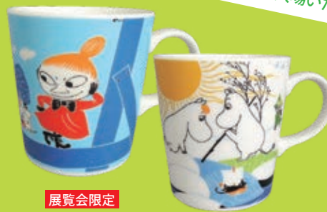
展覧会限定 マグカップ 各1,620円