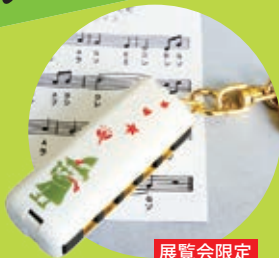
展覧会限定 スナフキンのハーモニカ 1,620円