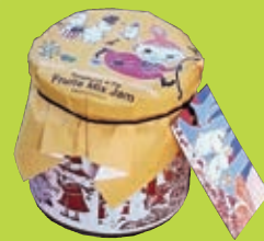
展覧会限定 フルーツミックスジャム 1,296円