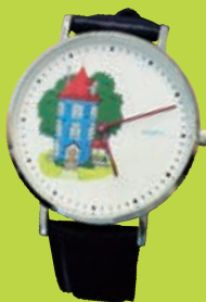
MOOMIN× U-TREASURE腕時計 (ムーミンハウス/ネイビー) 21,600円