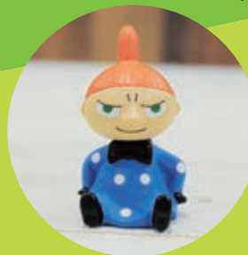
ゆらゆらドール リトルミイ ミニフィギュア 756円