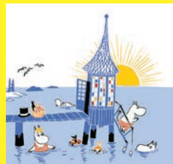
「ちびのミイがやってきた!」彩色原稿