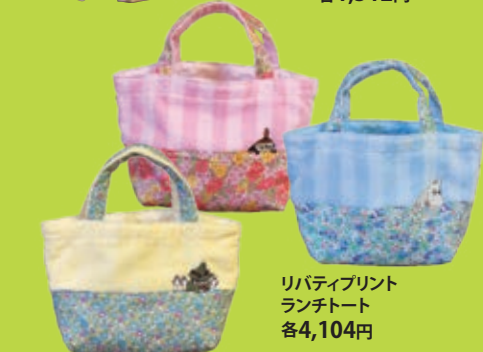
リバティプリント ランチトート 各4,104円